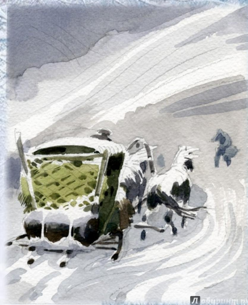
А.З.Иткин «Капитанская дочка»