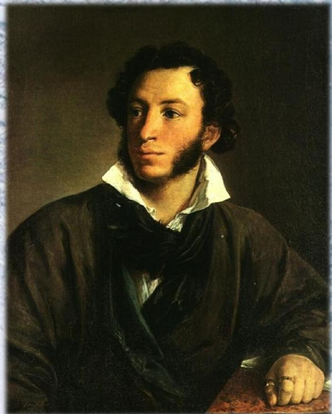
Пушкин А.С. 1799-1837 г.