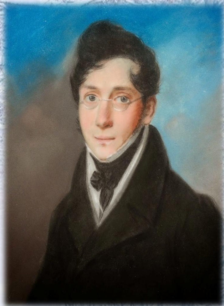
Вяземский П.А. 1792-1878